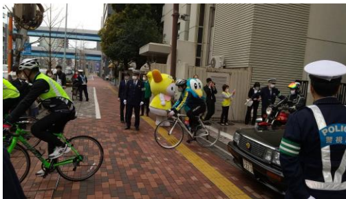
秋の交通安全パレードへ出発