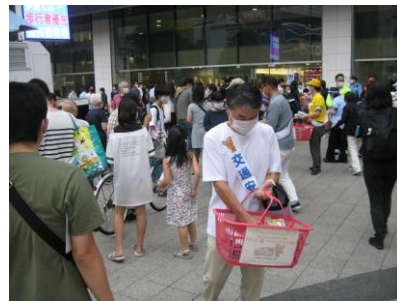
交通安全キャンペーングッズの配布