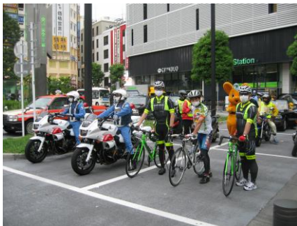
春の交通安全パレード出発前